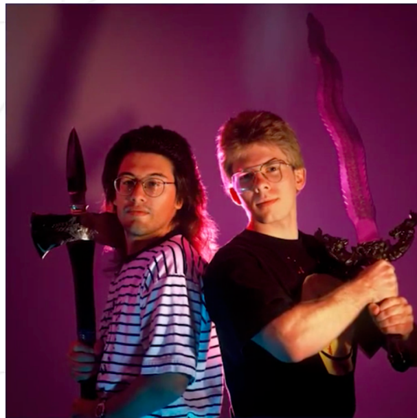
FIGURE I.1 – John Romero (gauche) et John Carmack (droite) posant pour la postérité

Développé par ID Software et les ultra-célèbres John Carmack et John Romero, publiée en 1992 par Apogee Software, Wolfenstein 3D est le premier "First Person Shooter" dans l'histoire du jeu-vidéo.