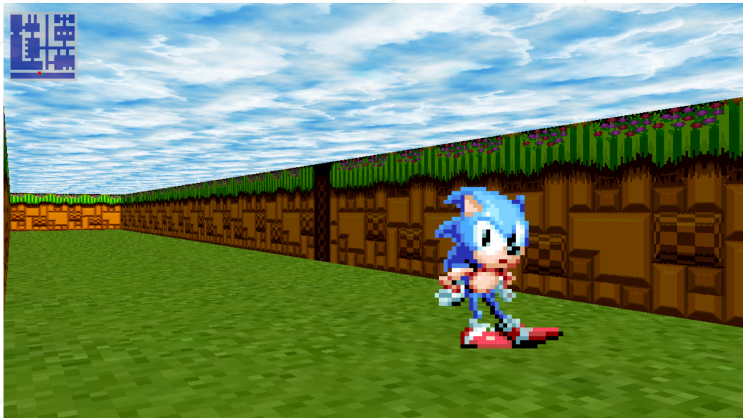
FIGURE VI.3 – Exemple de bonus avec une minimap, des textures sol et plafond, et un célèbre hérisson animé.